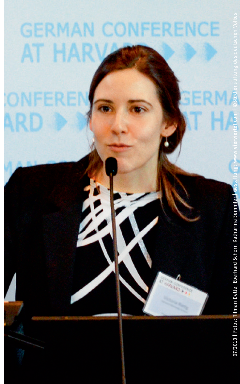
07/2013 | Fotos: Tilman Dette, Eberhard Schorr, Katharina Semmler | Gestaltung: www.vfenterei.com | ©Studienstiftung des deutschen Volkes

Absolventen der Harvard Kennedy School bekommen Zugang zu einem globalen Netzwerk. Sie sind in führenden Positionen bei nationalen Regierungen, den Vereinten Nationen, der Weltbank, Nichtregierungsorganisationen sowie in der Wissenschaft oder Privatwirtschaft tätig. Was sie verbindet, ist das Bestreben, für den internationalen Dialog und die Veränderung der Gesellschaft einzutreten.