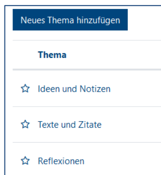
Abbildung 2: Forumsthemen

Ein Forum eignet sich deshalb gut als gemeinsames Lernjournal für Lerntandems und -gruppen oder zur Sammlung und Diskussion von Texten, weil Diskussionsthemen als thematische Struktur verwendet werden können. Durch die Eingabe (Vorgabe) von Diskussionsthemen kann also eine Art Inhaltsverzeichnis entstehen.