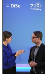
Reelansicht (Vollbild): 1080 x 1920 px

Das Video sollte in der Reelansicht 9:16 sein und mind. 1080 x 1920 Pixel haben.