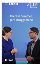
News-Feedansicht: 1080 x 1350 px

Im News Feed werden nur 1080 x 1350 px angezeigt. → d. h. im besten Fall sind im Reel die Texte und Logos alle innerhalb dieses Formats .