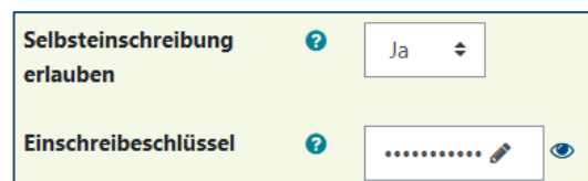
Abbildung 3: Selbsteinschreibung

Sollen sich die Teilnehmer/innen selbst in den Kurs einschreiben, müssen Sie nur noch entscheiden, ob dies mit Einschreibeschlüssel möglich sein soll. Sie können einen Einschreibeschlüssel für die Selbsteinschreibung hinzufügen, um den Zugang zum Kurs einzuschränken. Klicken Sie dazu auf das Zahnrad-Symbol bei der Einschreibemethode.